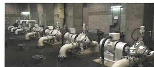
各種ポンプシステム

上水道施設を構成する各種ポンプ、受変電設備、動力制御設備、遠方監視制御設備等をトータルに提供し、維持管理に必要な保守点検サービスを行うことで、地域の水の安定供給を支えています。