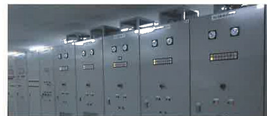
動力制御システム