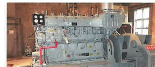
受変電・自家発電システム